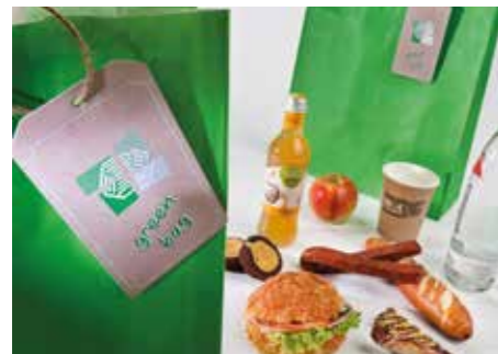
Gastronomie in COVID-19-Zeiten

Meetings und Tagungen, Kongresse und Konferenzen, Messen, Börsen und Ausstellungen sowie unzählige Events für Unternehmen und Organisationen schaffen einen starken Veranstaltungsmarkt. Und die deutsche Veranstaltungsbranche ist wirtschaftlich stark, sehr stark. Mittlerweile ist jede dritte Hotelübernachtung in Deutschland der Tagungswirtschaft geschuldet. 2,89 Mio. Veranstaltungen haben allein 2019 in Deutschland rund 423 Mio. Teilnehmer in ihren Bann gezogen. Diese Zahlen sprechen eine starke und deutliche Sprache. 2020 folgte dann eine harte Zäsur. Das Virus zwingt uns temporär zum Umdenken. Hygiene wird noch wichtiger, die Gastronomie noch anspruchsvoller. Fortlaufend haben wir in unserem kommunalen Veranstaltungshaus Konzepte entwickelt, wie wir den COVID-19-Wirren bestmöglich begegnen können. Also: Wie können wir mit der Situation umgehen? Natürlich haben wir alle Kostenträger neu bewertet und alles dafür getan, diese – sofern möglich – zu reduzieren. Auch das Kurzarbeitergeld leistet einen wertvollen Beitrag. Veranstaltungen führen wir in diesen Zeiten natürlich ebenfalls durch. Allerdings anders – und