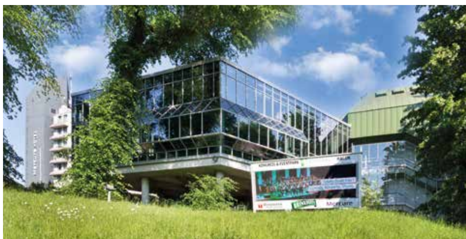
Kongress- und Eventpark Stadthalle Hagen

Ein Blick auf die Zahlen unserer Branche bestätigt: Wir sind mehr als Partys und Feiern. Neben den kulturellen Veranstaltungen, die einen sehr wichtigen breiten Raum einnehmen, gilt unser Interesse den ertragreichen Business-Veranstaltungen.